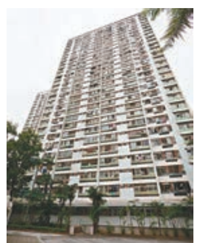
亦一直未有就公屋水費事宜設立中央紀錄以作整體監察。

公署又指出,水務署主要依靠向房署發出通知書和徵收逾期附加費以追討欠款,只單靠電腦系統重複向房署發出通知書,而沒有採取其他適切的追收水費行動,變相縱容房署拖延繳交水費,而房署過去