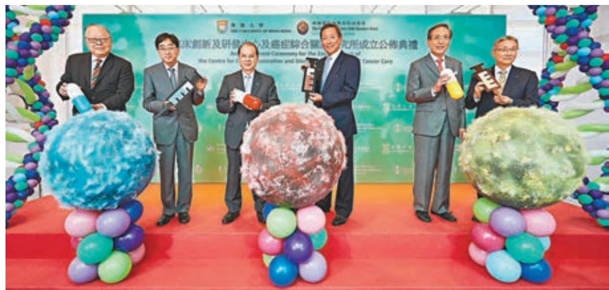
馬會捐款12.44億元予港大,支持港大李嘉誠醫學院於葛量洪醫院成立全港首個專門針對癌症的臨床創新及研發中心及癌症綜合關護研究所。

消息指,行會接納的方案當中包括20項建議,如加強社區照顧服務、減少住院比率,當中特區政府已計劃在10月份加推2,000張專門予中度至嚴重缺損長者的社區照顧服務券。至於輕度缺損的長者,關愛基金則預留4,000個名額讓他們使用門診及送飯服務,相信會在今年底前實施。