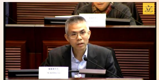
暨嘉華秘書長代表本會出席特別會議並發表意見。

去年發生的為期近 80 天的違法「佔中運動」，對香港社會造成了重大的衝擊，也給我們深刻的啟示：如果離開法治去追求民主，不僅無助於實現民主，而且嚴重損害社會秩序、經濟